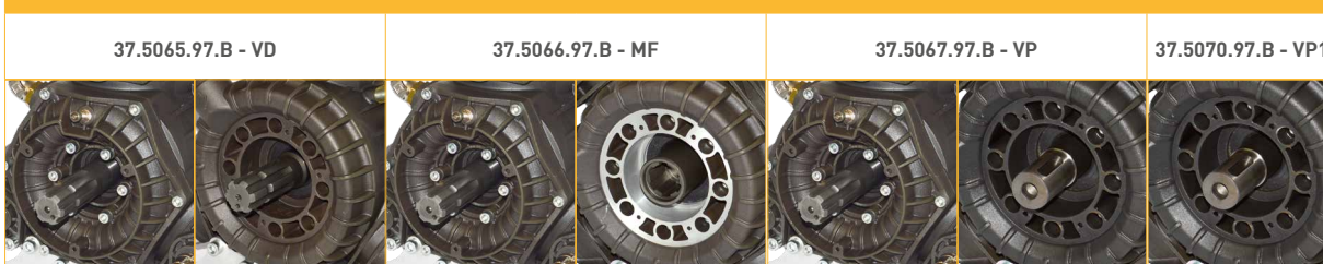
Anteriore/Front Posteriore/Rear Anteriore/Front Posteriore/Rear Anteriore/Front Posteriore/Rear Posteriore/Rear