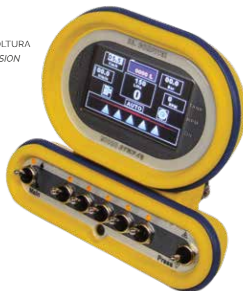
VERSIONE AGRICOLTURA AGRICULTURE VERSION

Software dedicato e selezionabile dall'operatore in funzione del tipo d'applicazione (macchine da diserbo o atomizzatori)