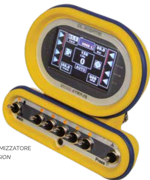
VERSIONE ATOMIZZATORE ATOMIZER VERSION

Computer compatto ed economico, studiato per quelle applicazioni dove è richiesto un computer semplice all'uso ma completo. Computer for the distribution of agro-chemicals, rugged construction, designed with simplicity in mind, computer-controller spraying has never been so easy.